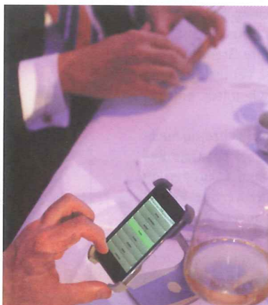
Selbst das Ambiente im Saal können die Teilnehmer mehrheitlich beeinflussen, wie hier bspw. die Lichtstimmung.

Interessant ist sicher die Möglichkeit, Eingaben der Anwender mit weiteren Funktionen zu verknüpfen: So gab es bereits eine Veranstaltung, bei der die Teilnehmer gemäß einer Idee der verantwortlichen Agentur JAZZUNIQUE bei ihrem Eintreffen ohne weiteren Kommentar iPod touch-Modelle auf den Tischen vorfanden, deren Inhalte von jeweils mehreren Personen erkundet werden konnten. In reger Diskussion wurde von