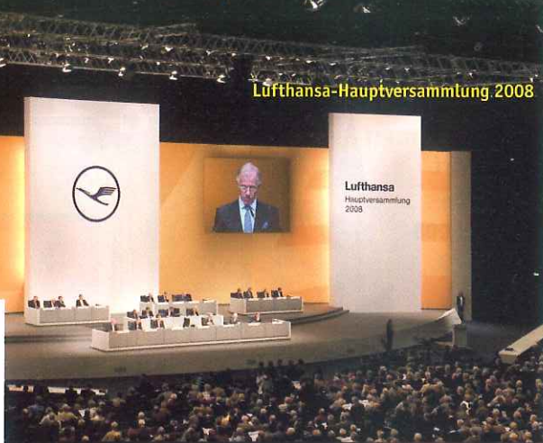
Taiwan Night im Rahmen der CeBIT 2008