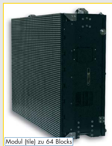
Modul (tile) zu 64 Blocks